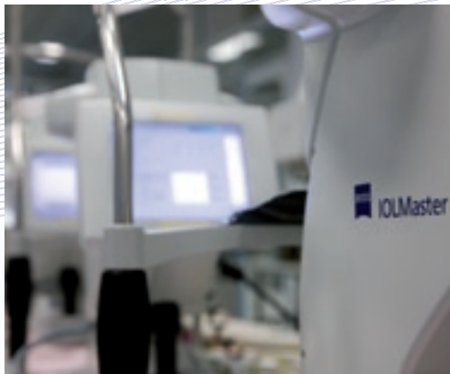
Fertigung des IOL Master in Jena – Carl Zeiss Meditec AG