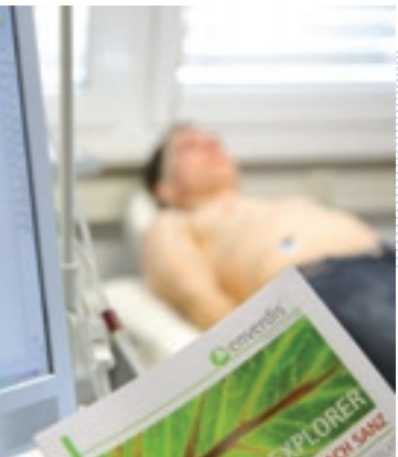
Untersuchung mit dem CARDIOLOGIC EXPLOLER – enverdis GmbH